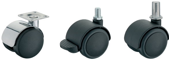
verchromt harte Lauffläche