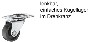
lenkbar, einfaches Kugellager im Drehkranz